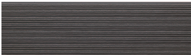
EFX3754G プラムMGチャコールII