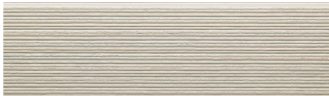
EFX3752G プラムMGアイボリーII